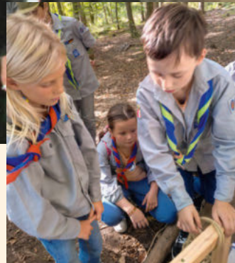
Knotenkunde bei den Pfadfindern