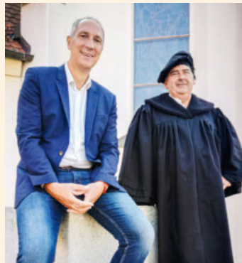
Reformationstag - Politik und Glauben