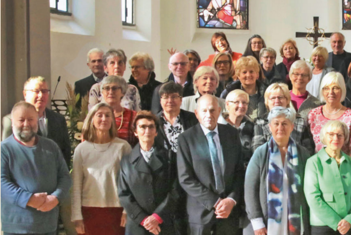
Jubelkonfirmanden bei der Goldenen Konfirmation